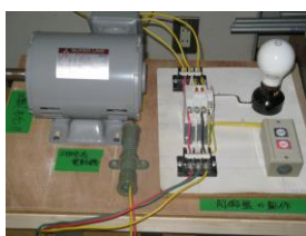
モーター制御実習