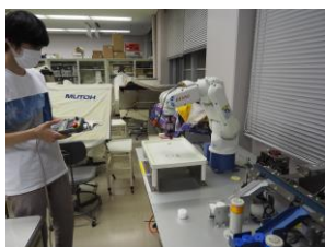
ロボット制御実習