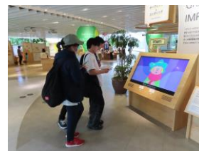
校外宿泊研修（修学旅行）