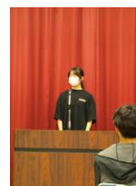
校内生活体験発表会