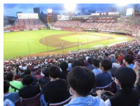
校外体験学習（遠足）