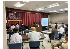
校内生活体験発表会