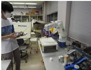
ロボット制御実習