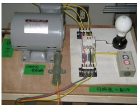
モーター制御実習